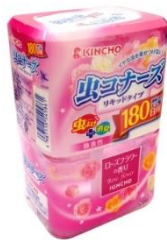
日本金鳥玫瑰花香液體防蟲 180 日 (兼消臭)