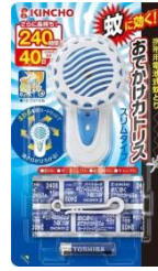
KINCHO 戶外攜帶型 電子驅蚊器