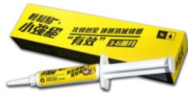
小強絶蟑螂凝膠餌劑