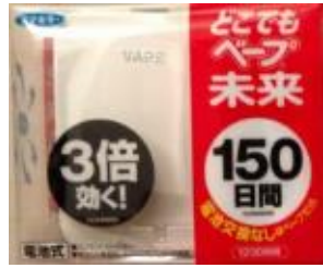
日本 VAPE 防蚊驅蚊器