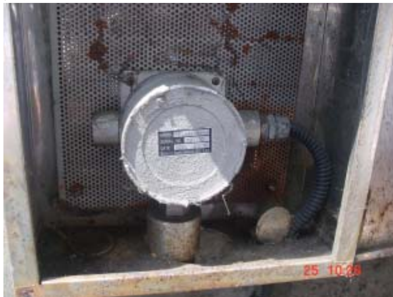
圖三、丙烯晴儲槽區旁之偵測器均已毀損