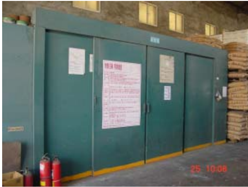
圖二、丙烯醯胺儲存區無放置物質安全資料表