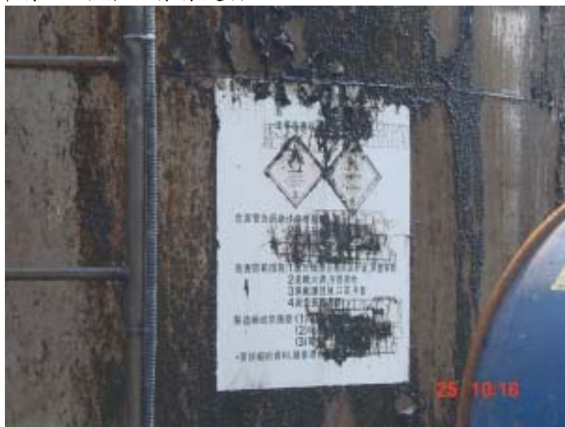
圖一、丙烯晴儲槽標示不明