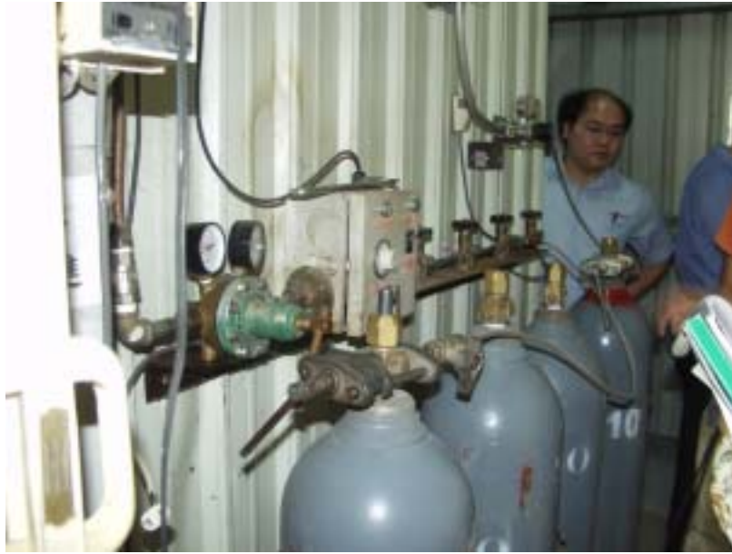
圖三、環氧乙烷鋼瓶無固定

5、廠方須加強鋼瓶洩漏之應變程序之演練，並購置處理工具組，以於洩漏發生時達到應變之效果。