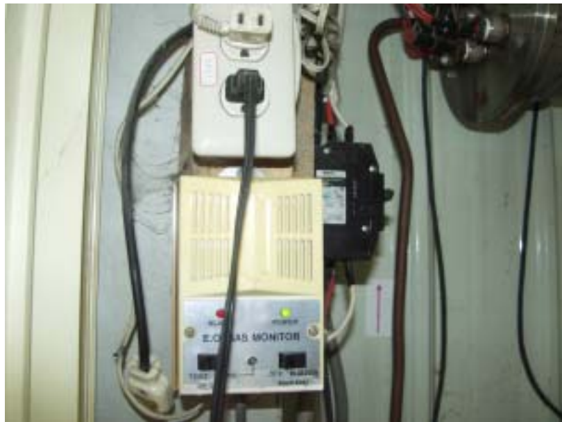
圖二、作業場所電器設備及插座及無防爆裝置