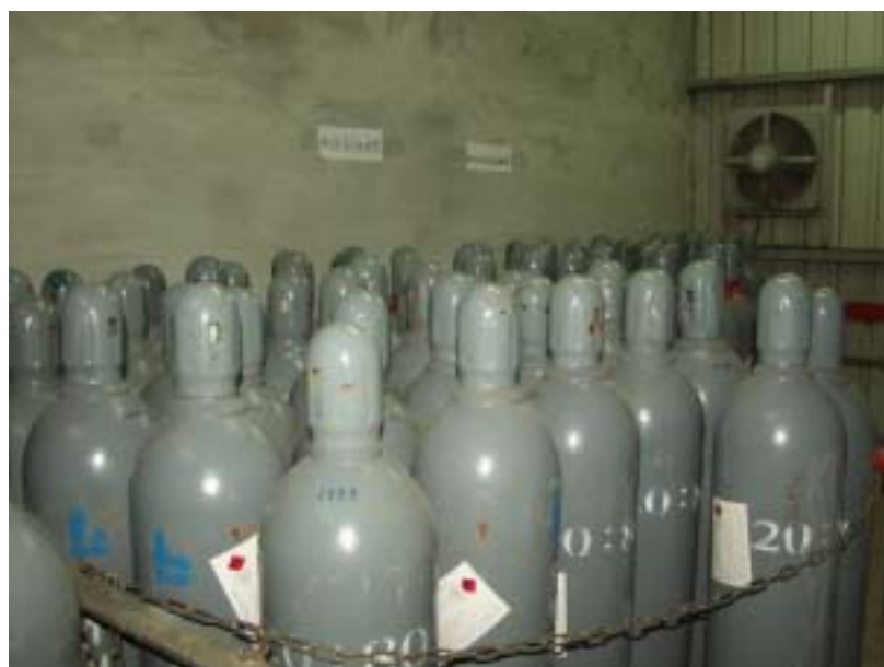
圖一、毒化物標示不明